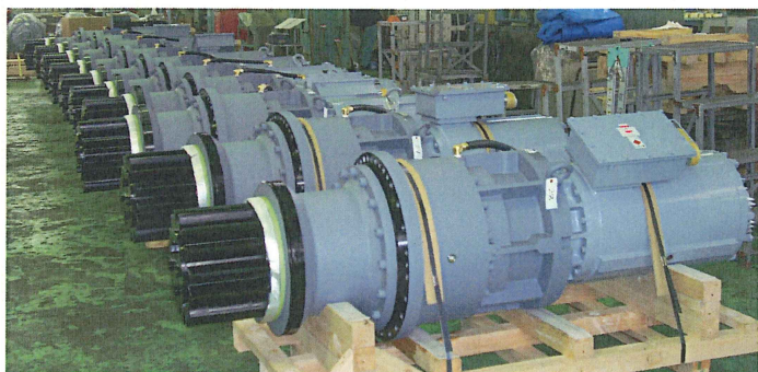
《中国向トルクリミッター(SSG110)60台出荷》